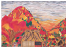
1. 赤朽葉の夕暮れ [B] 2. 阪上 清一郎 [2年生] 3. 高槻市立第二中学校