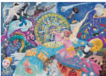
1. 夏の夜 [B] 2. 土手 結月 [3年生] 3. 高槻市立第二中学校