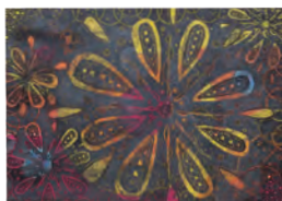
1.夜の秘宝 [B] 2.三木 紗礼 [1年生] 3.豊中市立第十四中学校