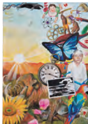
1.魂の記憶 [B] 2.宮下 陸生 [2年生] 3.姫路市立安室中学校