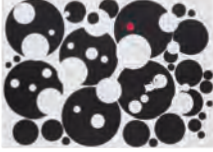
1. 浮遊 [A] 2. 北原 文平 [3年生] 3. 向日市立西ノ岡中学校