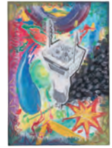
1. ロボットの感情 [B] 2. 勝手 萌加 [2年生] 3. 大阪市立新東淀中学校