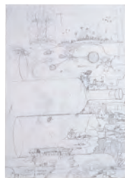
1.ピンの内と外 [B] 2.杉谷 俊輔 [3年生] 3.加藤学園暁秀中学校