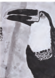
1.くちばしの大きい鳥 [B] 2.三谷 俊介 [2年生] 3.和歌山県立田辺中学校