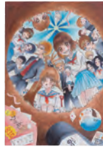
1. 20年後にまたここで [A] 2. 園田 乃々香 [2年生] 3. 神戸市立歌敷山中学校