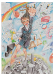
1.童心に帰ろう [A] 2.服部 玲奈 [3年生] 3.大阪市立東中学校