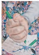
1. 気持ち [B] 2. 中浦 優有 [2年生] 3. 豊中市立第十四中学校