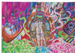
1.君にあげる未来 [A] 2.演名 あかり [2年生] 3.大阪市立大桐中学校