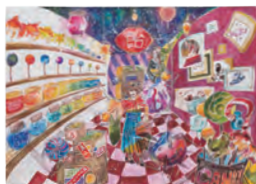
1.船売りの少女 [A] 2.箕浦 彩菜 [3年生] 3.宮城県仙台二華中学校