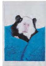
1. ニッピー [B] 2. 鈴木 海 [3年生] 3. 茨木市立三島中学校