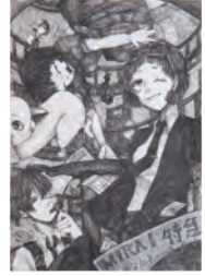
1. 未来特急 [A] 2. 山田 望緒 [2年生] 3. 東大阪市立若江中学校