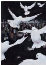
1. 未来へつなく [B] 2. 友井 歌子 [2年生] 3. 大阪市立白鷺中学校