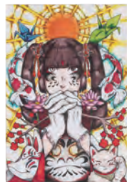
1.願いを掛けたのに [A] 2.仲宗根 美波 [3年生] 3.豊中市立第五中学校