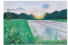
1. 散歩道から見える景色 [B] 2. 高橋 理加 [3年生] 3. 加古川市立山手中学校