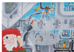
1.モノトーン [B] 2.井上 くるみ [3年生] 3.守口市立庭窪中学校