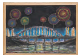
1.奉納花火Ⅲ [B] 2.中嶋 明都 [3年生] 3.栗東市立栗東西中学校