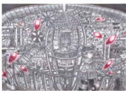
1.命の共存 [A] 2.阪本 涼 [2年生] 3.東大阪市立若江中学校