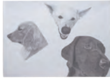
1. 大切な家族 [B] 2. 青野 響希 [3年生] 3. 加藤学園暁秀中学校