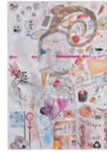
1. 今の娯楽は。 [B] 2. 奥村 祥晴 [3年生] 3. 大阪市立天王寺中学校